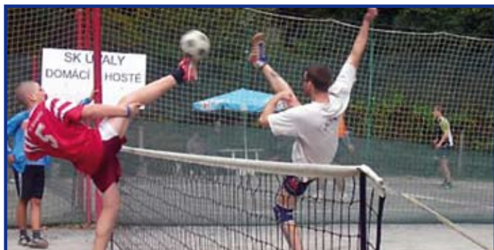
Jedna z mnohých hezkých nohejbalových akcí

Dne 3. 10. 2008 proběhl v areálu koupaliště již třetí ročník nohejbalového turnaje trojic. Sešlo se zde celkem jedenáct trojic, a tak se zvolil systém hry každý s každým. Počasí se vcelku vydařilo. Hrál se až do pozdních odpoledních hodin a byly zde vidět některé opravdu dobré zápasy mezi jednot-