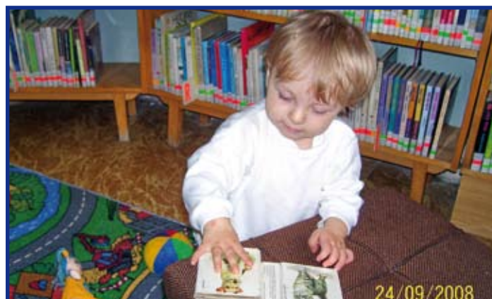
Jedna z nejmladších adeptek na čtenáře