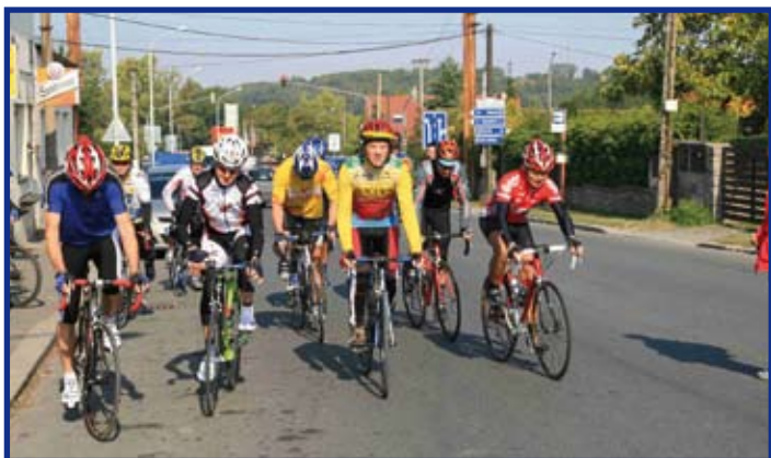
Hromadný start závodu

Dne 27. 9. 2008 se uskutečnil další ročník tradičního závodu Úvaly - Český Šternberk - Úvaly. Pořadatelé závodu se opět podařilo (po roční pauze) objednat příjemné slunné počasí. Trať byla výborně značena, na většině trasy se skvěl nově položený asfalt, takže podmínky pro cyklistiku byly prakticky ideální. Na trochu menší účasti se bohužel pravděpodobně projevila termínová kolize s probíhajícím MS v silniční cyklistice v Itálii a také to, že někteří borci, jak prohlásili, nechtějí hazardovat se svým jménem. Zřejmě se