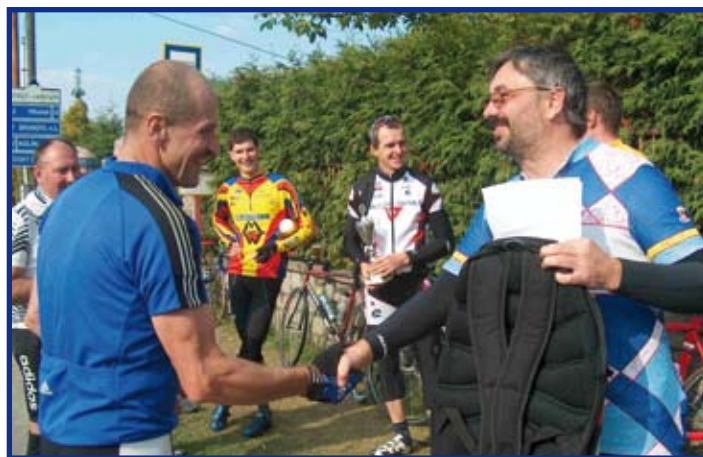
Vyhlášení vítězů „veteránů“