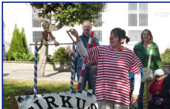
Představení cirkusu Fofr

Stánky rozmístěné po obvodu parku nabízely velké množství rozličných předmětů a výrobků, jemný calvados (z palírny v Tuklatech), jablečný mošt i výborná jablka přímo ze sadu. Děti i rodiče si mohli zasoutěžit v jablečných disciplínách (nejdelší jablečná slupka, pití moštu metrovým brčkem atd.), mohli si vyzkoušet, jak se drátuje, tká nebo přede vlna z ovčího rouna, nahlédnout do přízemí školy, kde celý den probíhala výtvarná soutěž ve výrobě pohlednic (opravdu jsme všechny poslali) a obrázků na téma podzim. Celý prostor byl vyzdoben různorodými, s citem a nevšedním nápadem vytvořenými obrázky, kolážemi a výtvary dětí základní školy. Do soutěže se zapojilo 11 třídních kolektivů. Pro nejmenší účastníky byl ve stínu lípy připraven cirkus FOFR, jehož představení se pro velký úspěch dočkalo tři