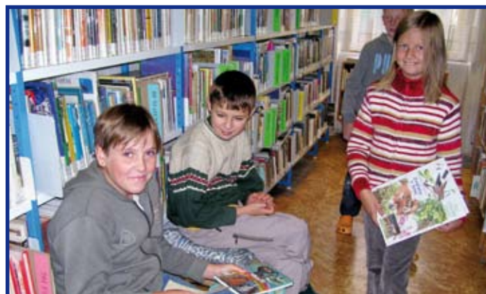
Žáci při práci s knihou a informacemi

za pracovnice městské knihovny Mgr. Alena Janurová