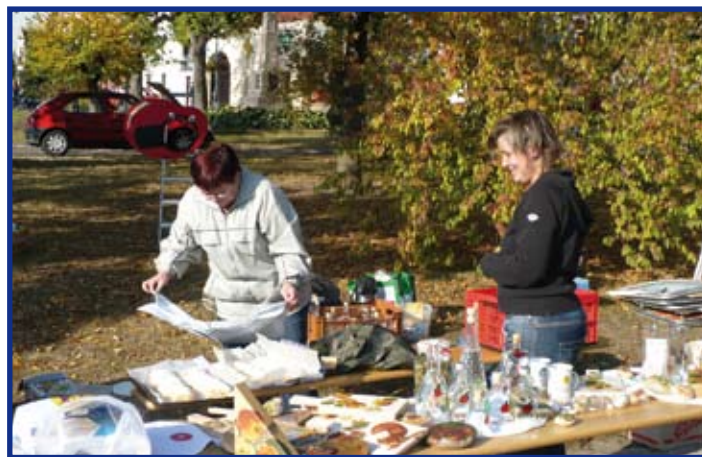
Výrobky z dílny Nová šance

S úspěchem proběhla také soutěž o nejlepší kulinářský počín, kde celkem pět kuchtíků přineslo hotové výrobky z jablek. Tuto soutěž velmi obzvlášť kladně hodnotila v odpoledních hodinách už značně vyhladovělá porota.