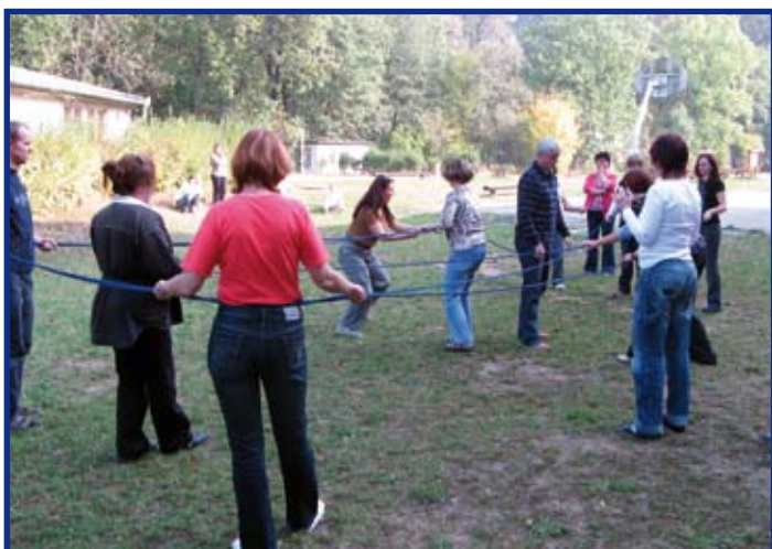
Školení pedagogů ZŠ, foto Ing. B. Morávková

Je to zároveň i jedna z možností, kdy si učitelé mohou vyzkoušet, jaké je to být žáky a valná část aktivit je takto i