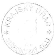
Alena Kultová odborný referent

Poučení o odvolání: Proti tomuto rozhodnutí se lze dle § 81 zákona č. 500/2004 Sb., správního řádu, ve znění pozdějších předpisů, odvolat do 15 dnů ode dne jeho oznámení, a to podáním učiněným u správního orgánu Krajský úřad Středočeského kraje, Krajský úřad Středočeského kraje - odbor sociálních věcí, pracoviště Zborovská 81/11, Praha 5-Smíchov, 150 21 Praha 5, který rozhodnutí vydal. O podaném odvolání rozhoduje Ministerstvo práce a sociálních věcí ČR.