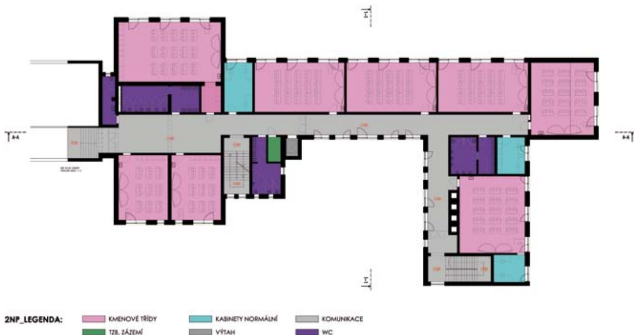
2NP_LEGENDA: KVMENOVÉ TRÍDY KABINETY NORMÁLNÍ KOMUNIKACE TZB, ZÁZEMÍ VÝTAH WC