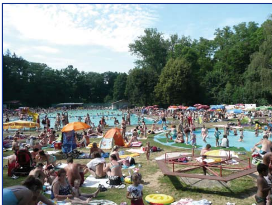
11. července 2010, více než 30 °C ve stínu, 2x foto Ing. V. Procházka