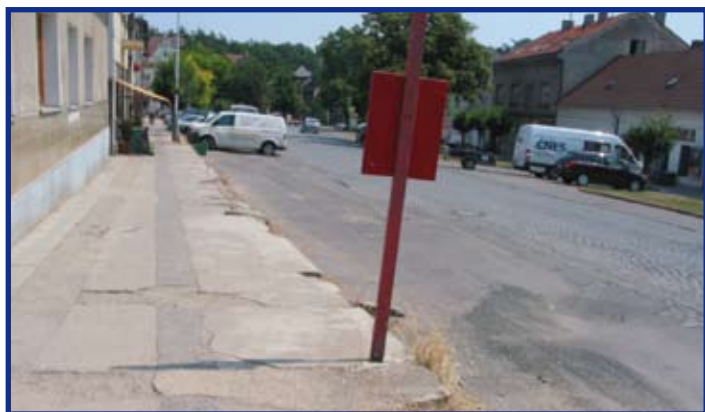
Chodník před zahájením opravy

Na základě výběrového řízení na zakázku malého rozsahu „Stavební úpravy náměstí Arnošta z Pardubic v Úvalech – část 1 – severní chodník, Dostavba areálu úvalských škol – novostavba a rekonstrukce veřejných komunikací, I. etapa“ byla zahájena oprava chodníku na náměstí Arnošta z Pardubic od ulice Tyršova k Základní škole v Úvalech.