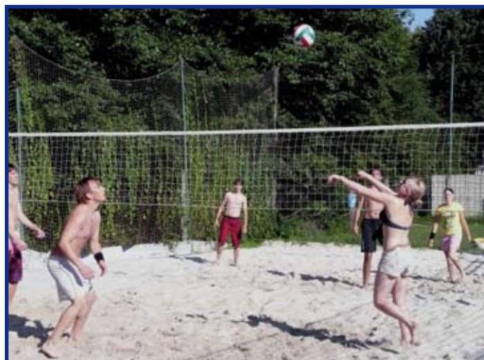
Na koupališti je možné si zahrát plážový volejbal

Vybudovali jsme druhé hřiště na plážový volejbal a místo na grilované lahůdky. Zakoupili jsme další lehátka na zapůjčování, přibyla houpačka pro děti. V rámci našich možností jsme zvýšili počet par-