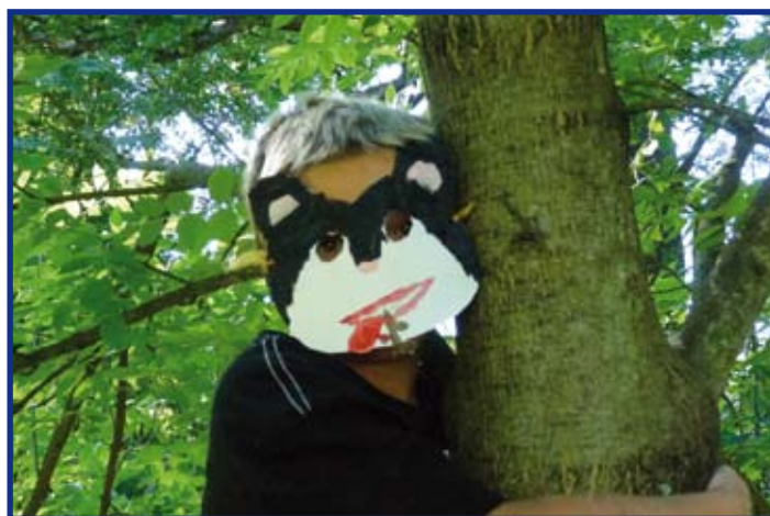
Panda Filip právě sleduje, co se v téhle zvířecí říši děje a nechce se mu dolů na zem

Letos MDDM pořádá 4 příměstské a 5 pobytových táborů, tak možná i s námi hezký zbytek prázdnin přeje Jana Pospíšilová.