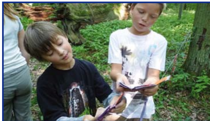
Při soutěži Safari nás pěkně prohnali strážci, ale stejně jsme byli úspěšní