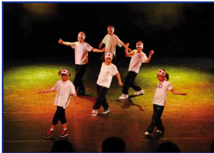
Taneční akademie