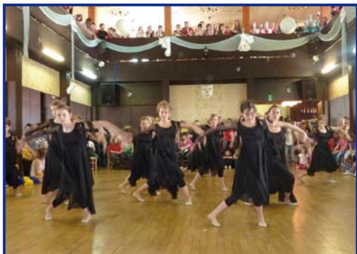
Soutěž v Čáslavi. Rytmus III ve skladbě "Black Ladies"