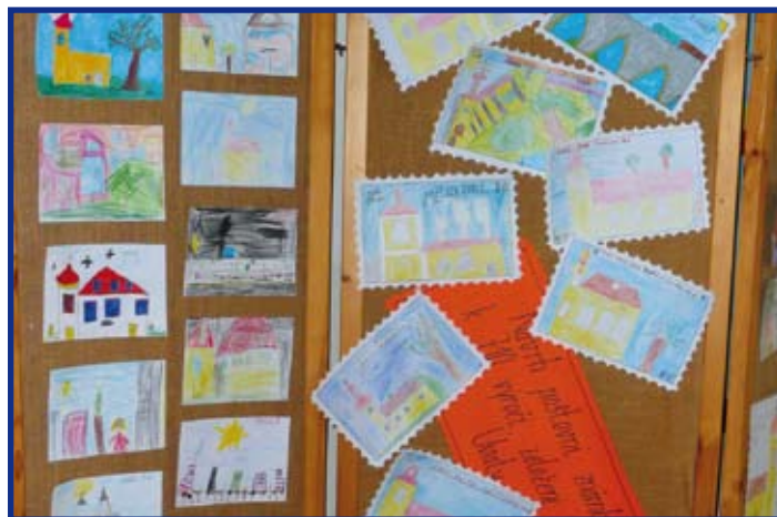
Několik ukávek ze školní výstavy