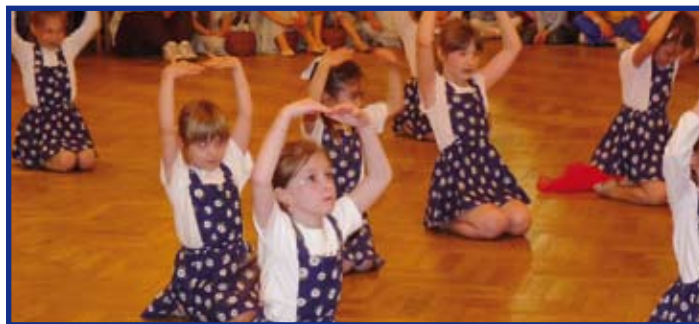
Rytmus IB při vystoupení na Čelákovické duběnce ve skladbě „Velké prádlo“