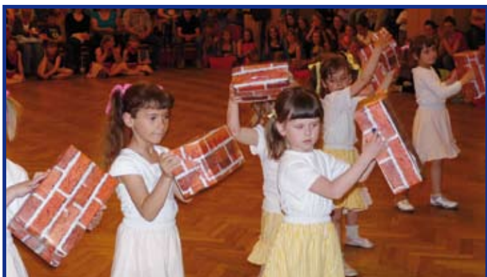
Přípravka Rytmus vystoupila na Čelákovické duběnce se skladbou „Zednická“, foto A. Navrátilová

Tančení je náš život.....to je heslo, za které se postaví většina dětí z TS Rytmus a je jich stále víc a víc. Soutěžní atmosféra postupně získává nové a nové tanečnický, kteří možnost jet na soutěž radí před všechny další lákavé akce.