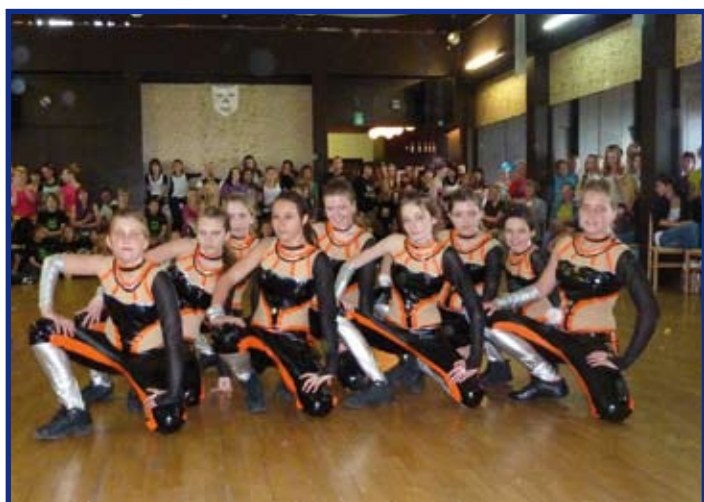
Rytmus III diskó se na soutěži v Čáslavi představil se skladbou „To jsme my“