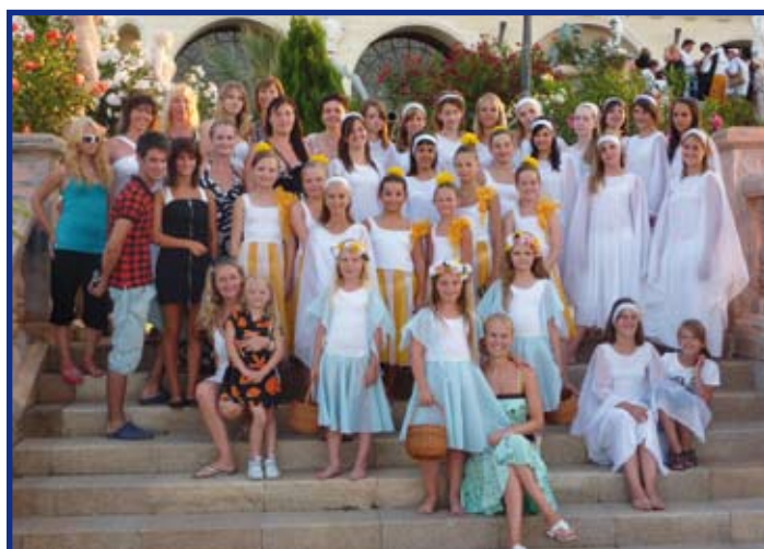
Účastníci zájezdu do Itálie u „svatebního zámku“