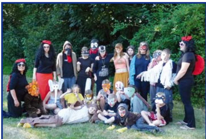
Zástupci „Říše zvířat“ u fotografa