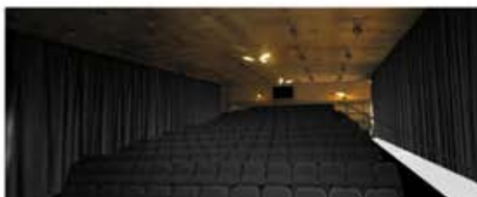
Montáž: Hala „Multitec“ zitra ??

Už jen desítky dní nás dělí od okamžiku, kdy budete mít šanci podpořit ODS a tím i uskutečnění připravených investičních akcí v celkové výši přesahující půl miliardy Kč