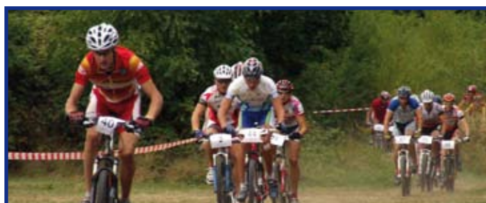
Snímek z loňské Velké ceny města Úval