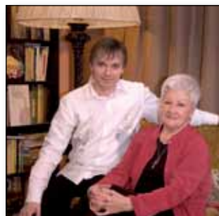
Samota není osamění, str. 10