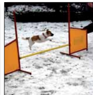
Agility str. 15