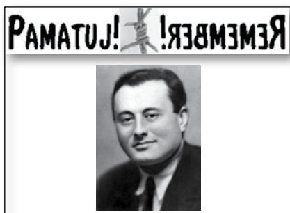
Happening 8. 3., str. 8