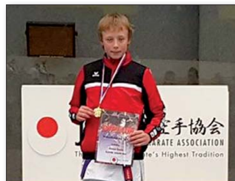
Mladí karatisté na stupních vítězů, str. 17