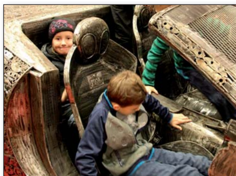
Jak tráví mladí hasiči podzim, str. 13