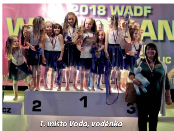
1. místo Voda, voděnka