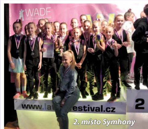
2. místo Symhony