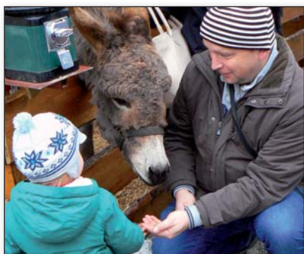
Vánoční trhy v Úvalech, str. 9