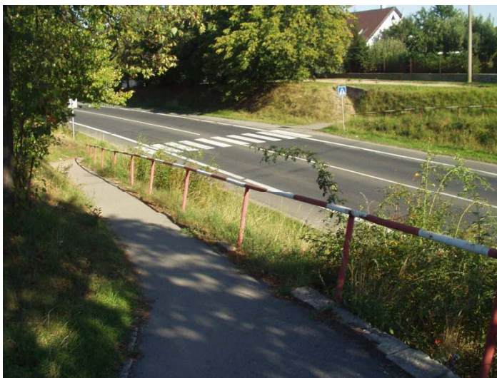
Bezpečnost na silnici I/12 je jednou z priorit.

Možné je i použít signalizaci a pohyby osob a dopravních prostředků časově oddělit. Dobré řešení je také automobil (nebo cyklisty) z některých tras vyloučit. Organizace provozu může v Úvalech ještě mnohé zlepšit. Ale je tu také prostor pro modernizaci a nová netradiční řešení.