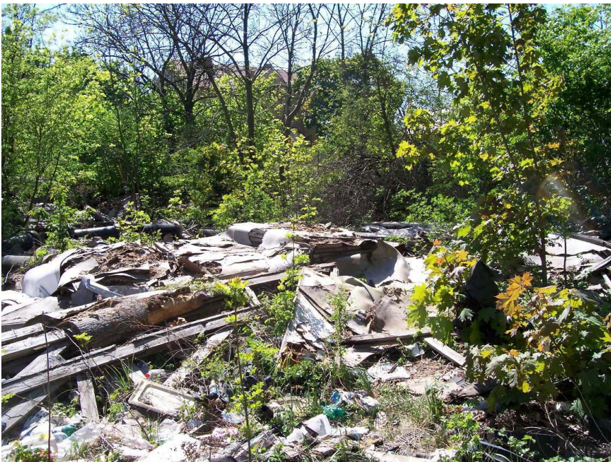
Černá skládka na cenných pozemcích v oblasti „cukrovaru“.

V případě velkých investorů a rozsáhlých investic by však město, vzhledem ke svému vysokému vnitřnímu dluhu, který byl demaskován Integrovaným plánem rozvoje, vyvinout úsilí k získání daleko větších finančních prostředků, které by zajistily souměrný rozvoj centrálních (starých) částí a čtvrtí nově vznikajících.