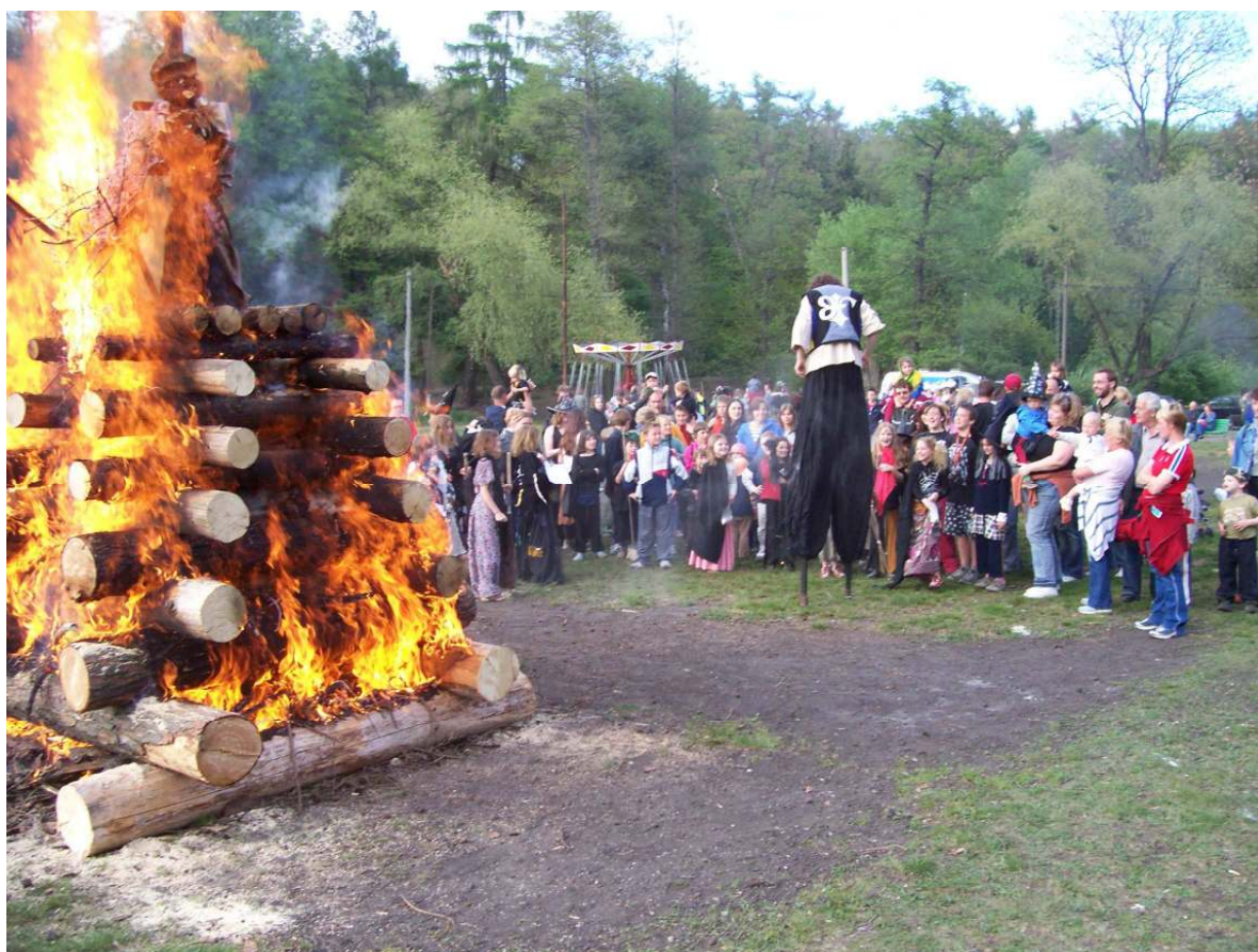
Společenský život v Úvalech: Každoroční „oslavý pálení čarodějnic“

K podpoře sociální integrace slouží i opatření k posílení všech forem lokálního života a bezpečného života další opatření sociální a společenské povahy, která mohou pomoci k eliminaci ohnisek sociálního napětí mezi starými a novými obyvateli, mezi „bohatými a chudými“. Nezanedbatelnou stránkou integračních snah je i podpora občanské participace na rozhodování a řízení města a podpora občanským sdružením.