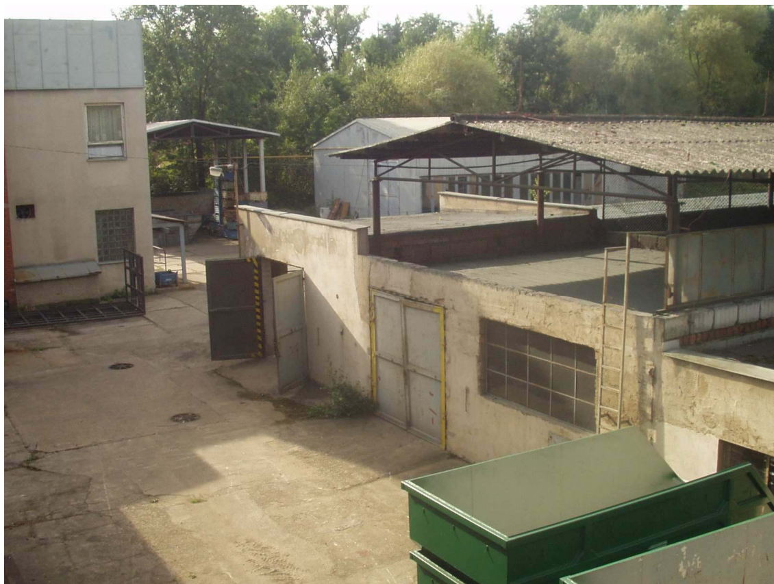
Areál „Multitec“ a přilehlé údolí Výmoly – možné budoucí součásti městského centra