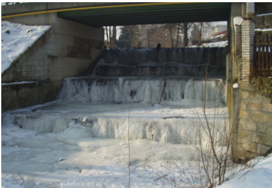
Tuhá zima 2006 postihla i přepad pod rybníkem Fabrák