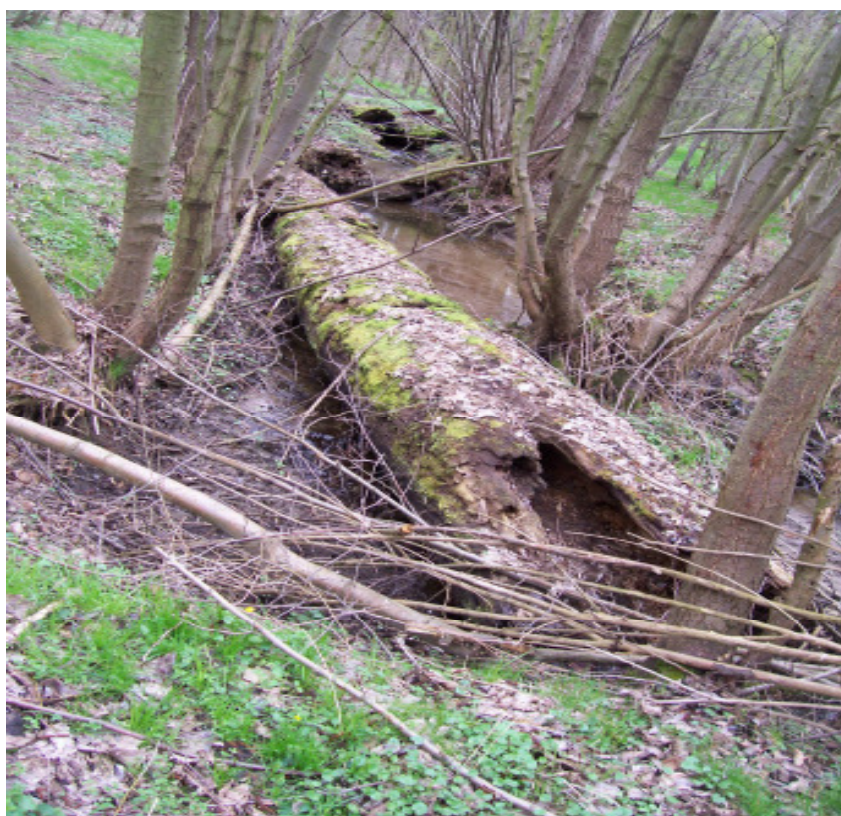
„pralesní“ romantika údolí Škvoreckého potoka