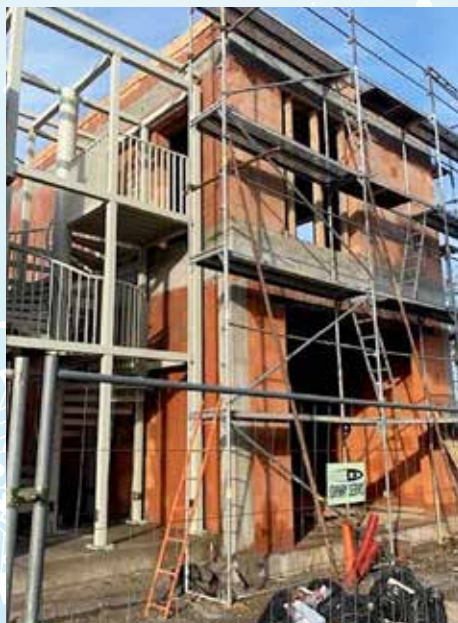
Stavba nové části hasičské základny