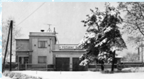
Hasičská zbrojnice v 60. letech 20. stol.