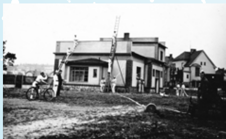
Úvalští hasiči cvičí v roce 1939 u nové zbrojnice