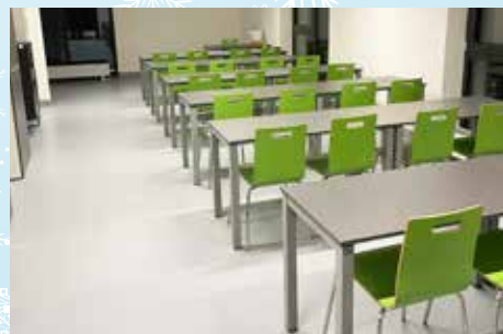
Nová školící místnost