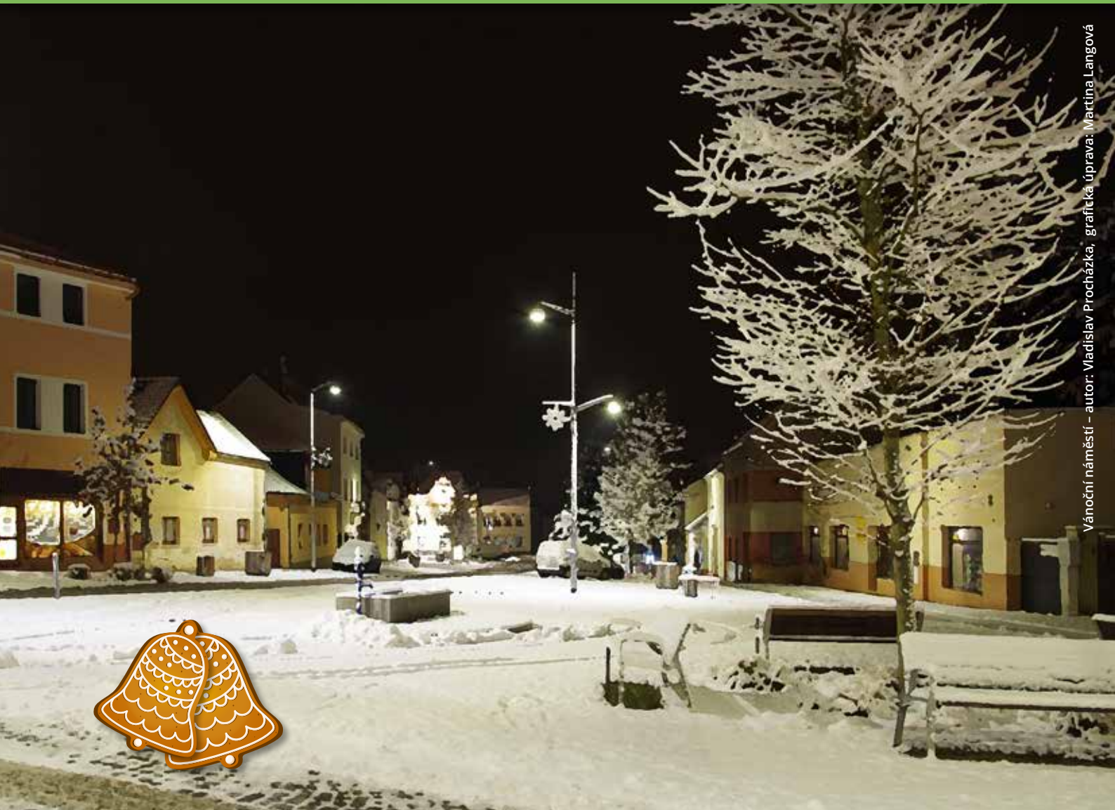
Vánoční náměstí - autor: Vladislav Procházka, grafická úprava: Martina Langová