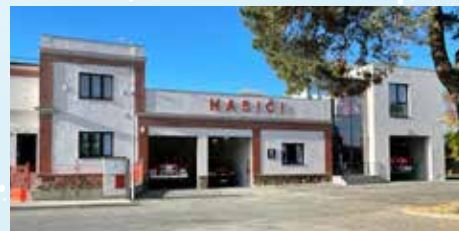
Moderní hasičská základna