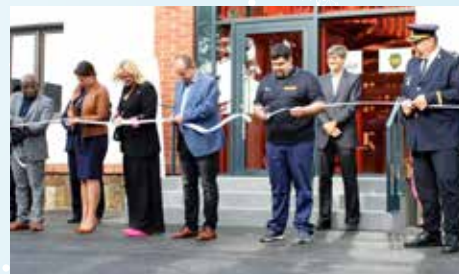
Slavnostní otevření moderní hasičské základny