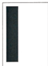
1/3 strany 59x262 mm