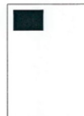
1/8 strany 90x61 mm

Rozměry inzerčních stran: šířka x výška v milimetrech