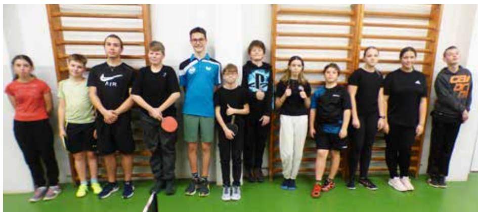
Vánočního turnaje se zúčastnilo 12 našich žáků