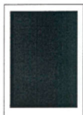
1/1 strany (zrcadlo) 190x262 mm 1/1 na spad 210x297 mm