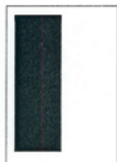
1/2 strany 90x262 mm