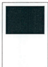
1/2 strany 190x128 mm