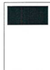
1/3 strany 190x87 mm