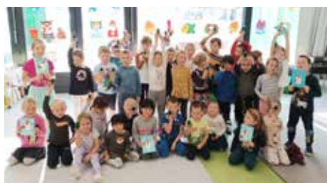
Dárčky do Lysé nad Labem

A kde se také dozvíte spoustu zajímavého o vánočních zvycích? Určitě v knihovně, a nejlépe v té naší Městské knihovně Úvaly.