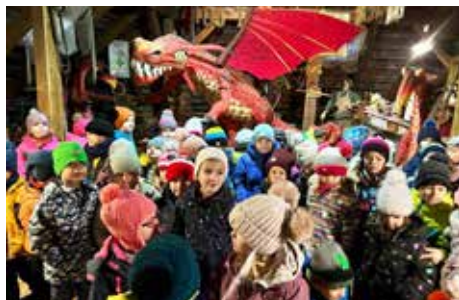
Krabice od bot