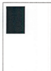
1/4 strany 90x128 mm