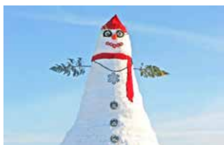
Ze života sněhuláků