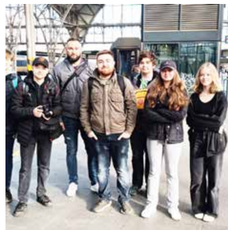
● Tým ZŠ Úvaly