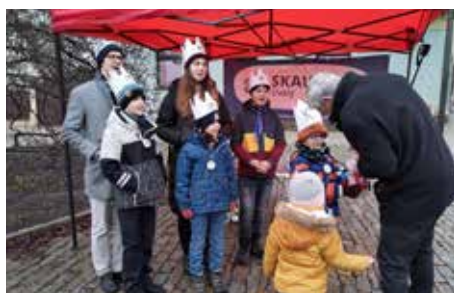
Všimli jsme si, že...