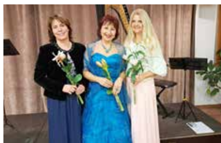
Lístky z kalendáře...