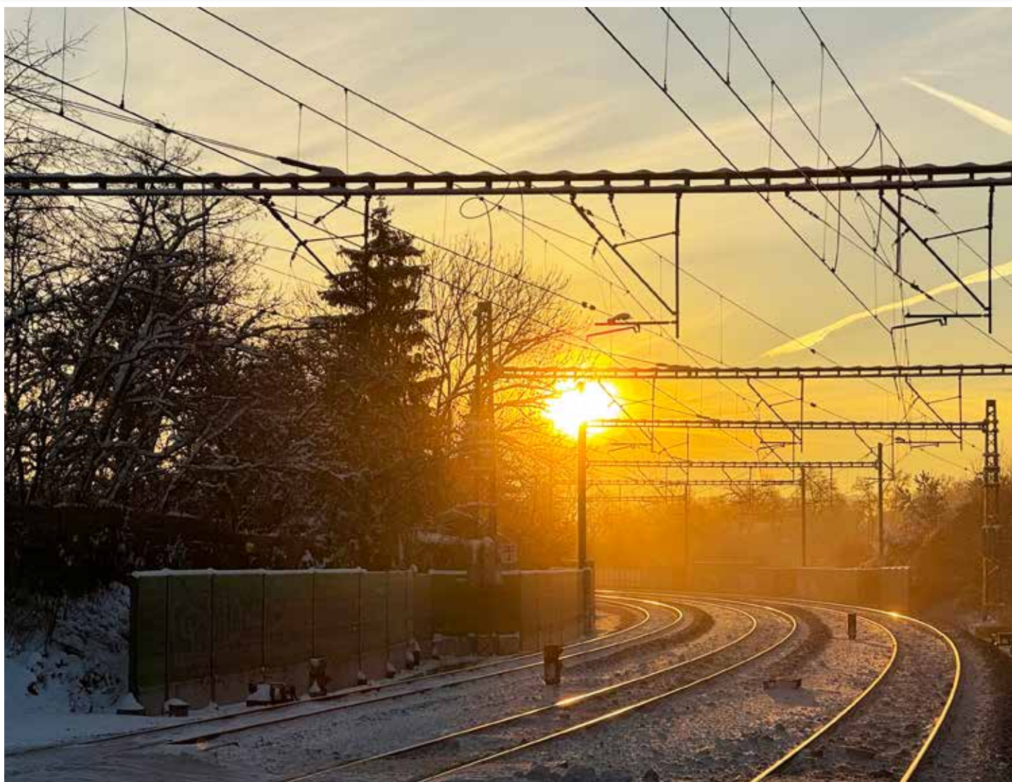
Únorové železniční svítání