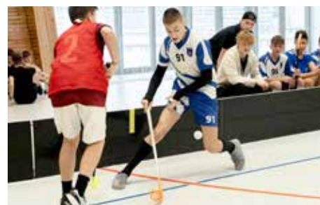
Sport a Fun Academy...