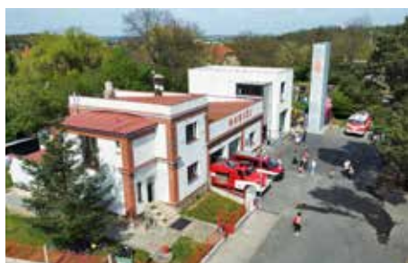
Den otevřených dveří...