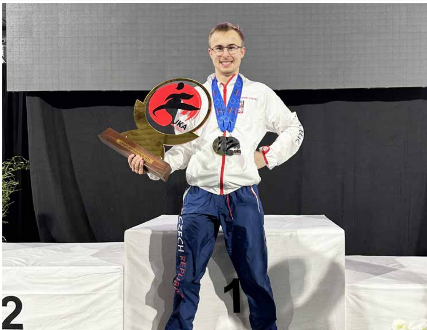
Ondřej Charvát – mistr Evropy v karate