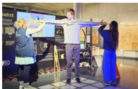
Pohled do života úvalské...