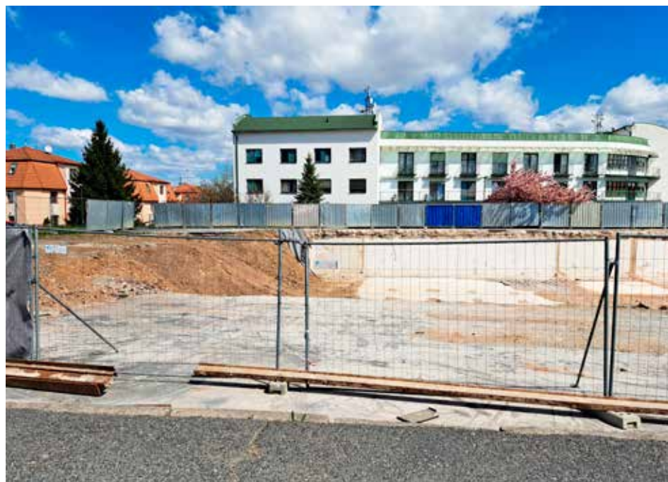
Demolice objektu bývalé velkoprodejniny dokončena

... snad jen náhoda, že nebyla hřiště o svátcích na stopro využívána, ale přítomní měli připomínky ke zlepšení. Mohly by být na hřištích pro větší děti a dospělé Toi-toi, třeba i na kovový peníz. Také jsou prý známa ekologická WC, např. veřejná kompostovací toaleta s finskou technologií GREEN TOILET. Jiným návštěvníkům vadí vulgární okřikování a vyhánění dětí hrajících fotbal. Jedno hřiště je ještě společensky nezavedeno do povědomí, je krásné a bez problémů, že budou uživatelé rušit hlukem. Je uprostřed zeleně, ale v létě od 15. 6. do 15. 9. bude přístupné jen přes vstupní na koupaliště. Jinak je v provozu od dubna do října. Bez omezení je hřiště na Vinici, kde ale podle návštěvníků chybí koš na odpadky a také Toika. Mají však toto hřiště moc rádi.