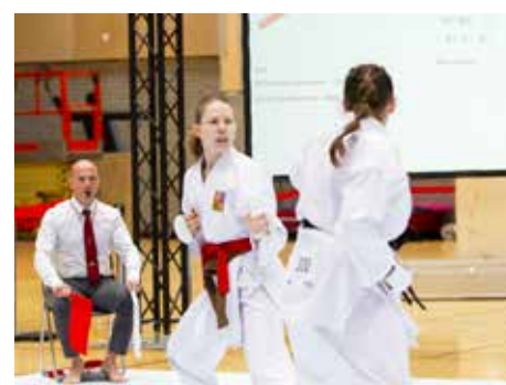
Mistrovství Evropy v karate... 21