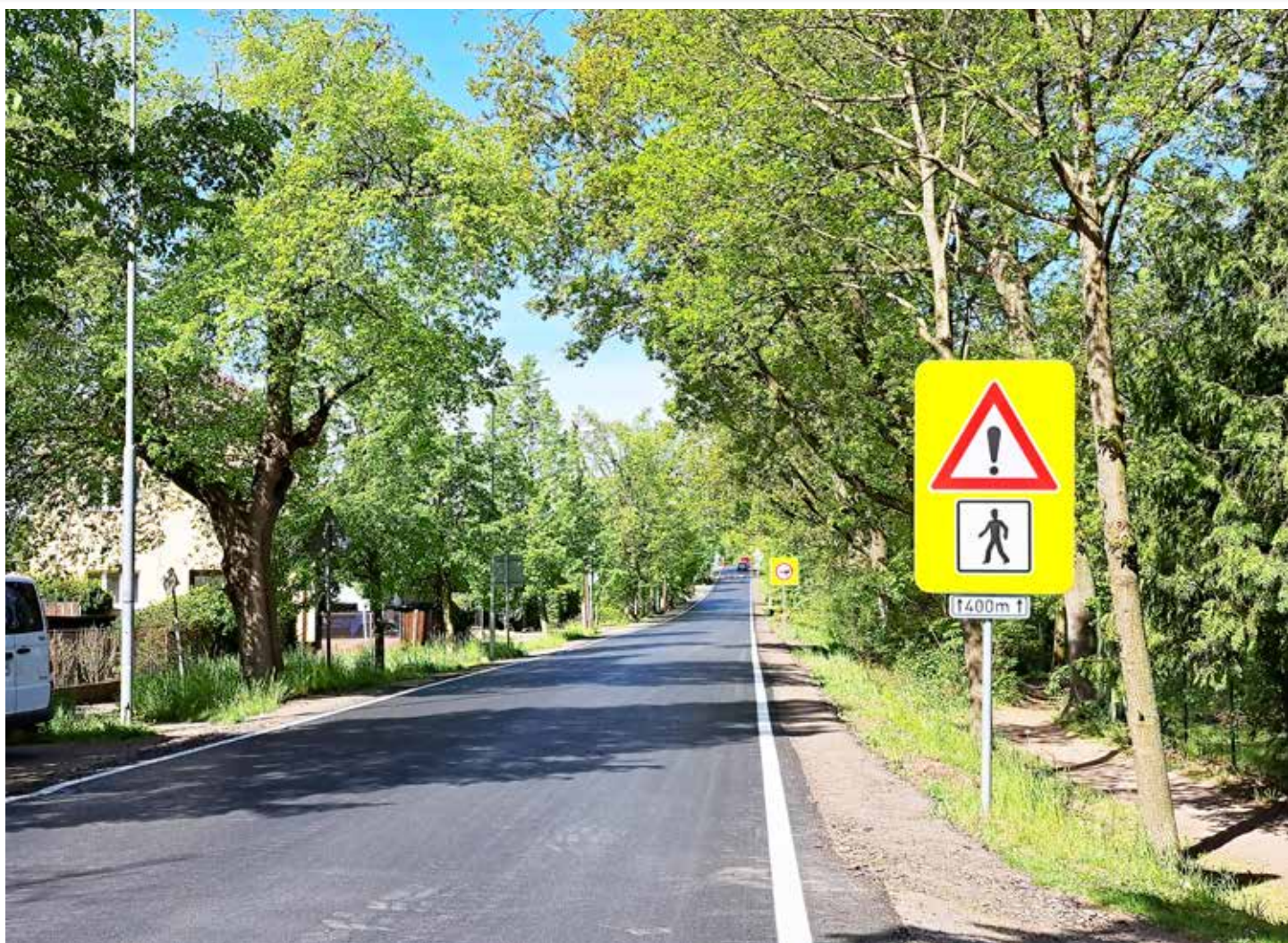
Pražská jako vymalovaná