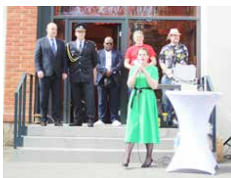
Oslava 140 let SDH Úvaly... 10