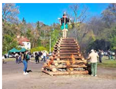
Lístky z kalendáře... 14